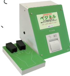
野菜摂取度測定器「ベジミル」使用