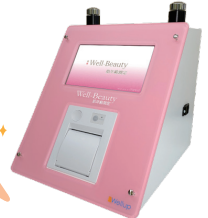
肌年齢測定器「Well Beauty SM30」使用