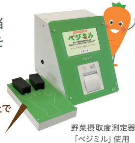
野菜摂取度測定器「ベジミル」使用

めざせ！ 野菜摂取レベル(測定値) C+ 以上で 推定野菜摂取量 350g 以上!